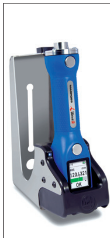
充電ステーション

記載されているブルートゥースは Bluetooth® SIG Inc. の登録商標および商標です。マーポスでの使用はライセンス許可に基づいております。その他の登録商標及び商標はそれぞれの所有者が権利を有します。