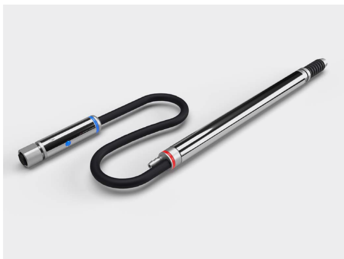
RedCrown2 Smart: Todos los modelos RedCrown2 son disponibles en versión SMART