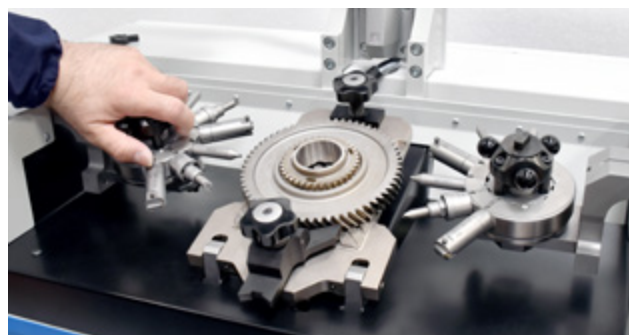
使いやすく、段取り替えが簡単